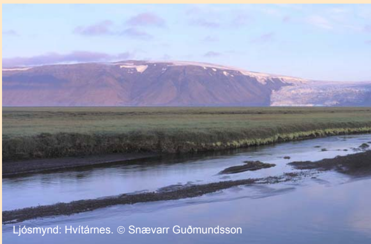
Ljósmynd: Hvítárnes.

Talsvert fuglalíf, meðal annars verpa á svæðinu heiðagæsir og mófuglar verpa í Hvítárnesi.